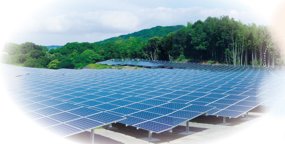
完成した「神在太陽光発電所」(福岡県)