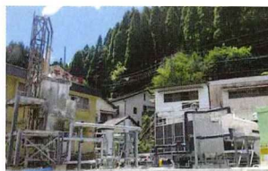
杖立温泉バイナリー発電所