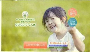
グリーンコープでんきのHPのトップ画面