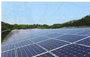
神在太陽光発電所